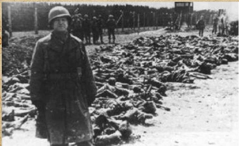
8 Mai 1945 – Massacre de Sétif